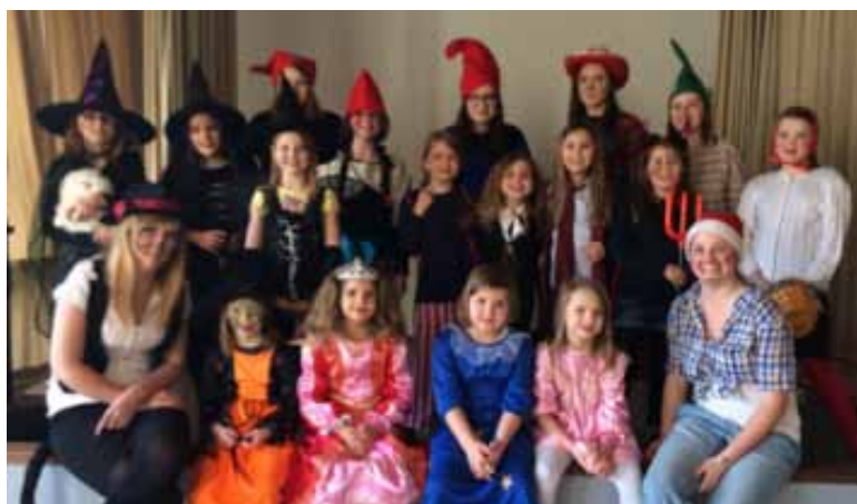
Fasching bei der JS Kefermarkt