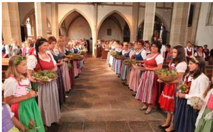
Goldhaubengruppe - Kräutersegnung - Gusentaler Hornbläserquintett