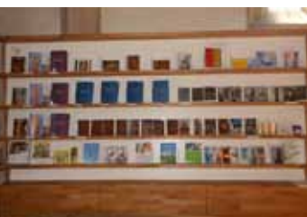
Schriftenstand in der Pfarrkirche

anschließend gemütliches Beisammensein bei Kaffee/ Tee und Kuchen im Pfarrheim.