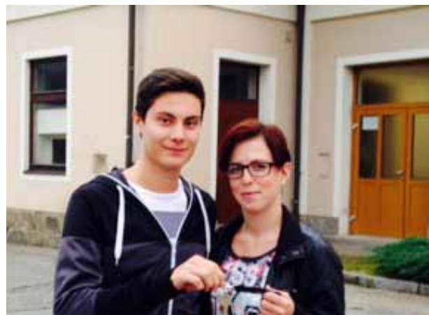
Schlüsselübergabe im Jugendzentrum