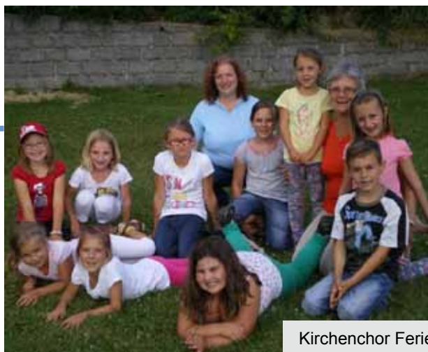
Kirchenchor Ferienpass „Singen mit Pfiff“