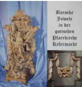
Barocke Juwelen