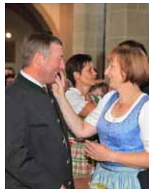
Fest der Jubelpaare mit Gnadenhochzeitspaar