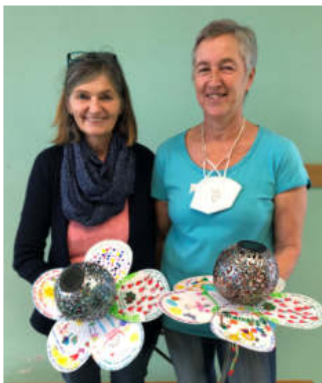
DANKE sagt das gesamte Kindergarten- und Krabbelstubenteam

Man ist es mit Herz und Seele, ein ganzes Leben lang, so wie IHR.“